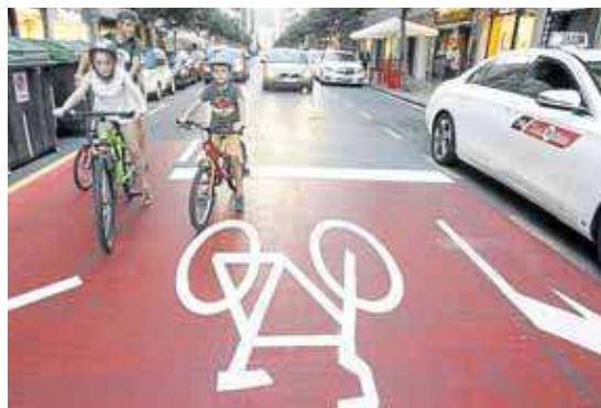
Bidegorri en Máximo Aguirre con Licenciado Poza.

afluencia, mientras otros contabilizan un número inferior de pasos, como Julian Gaiarre, Askatasuna o Avenida del Ferrocarril. “Es una información muy valiosa para poder seguir implementando nuevas lógicas ciclistas”, dijo Gil. De hecho, a lo largo del 2018, el primer aforador instalado en la capital vizcaina sumó un total de 314.768 pasos de bicicletas. Ese mismo bidegorri lleva contabilizados 270.353 pasos hasta agosto, por lo que se prevé aumentar el número al finalizar el año.